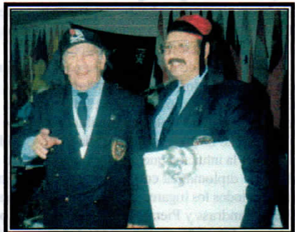
Foto enviada por Email por el Capitán Black y recibida por el computador de la Nao Santiago, de acuerdo a las nuevas tecnologías.

Sería interesante que las Naos que leen este pasquín envíen saludos de bienvenida a los nuevos hermanos.