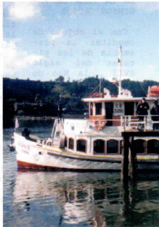
Barco del zafarrancho de Valdivia 1999

El resto del tiempo, un bucán sabroso con orzas para las victoriosas fuerzas de combate.