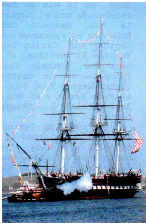
USS Constitution.USA 1797, hoy en Boston

La Nao Santiago felicita a tan aguerrido hermano por su nuevo mando.