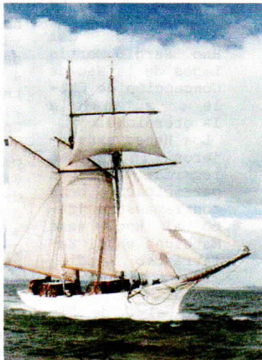
La Belle Poule. France. 1932.

Parte de la tripulación permaneció en la guarida hasta la noche en animada conversación.