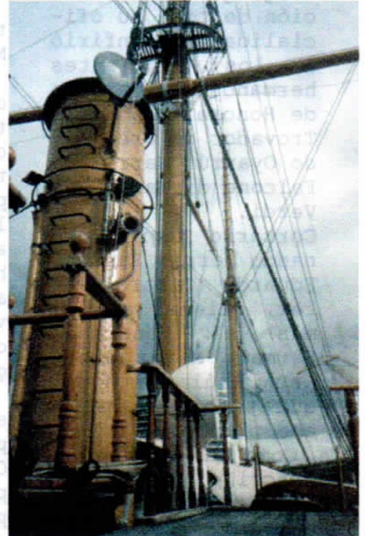
Cubierta del buque Uruguay en puerto Madero.

Su conversación con los animadores acerca del rescate de naufragios y su pertenencia a la Hermandad de la Costa fue muy interesante y logró según los ranking una alta sintonía.