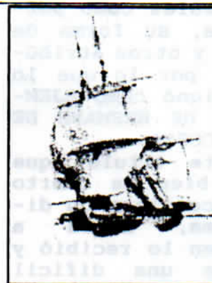
Corbeta Astrolabe ( 1838 )

Finalmente el Capitán, agradece a la oficialidad y hermanos la participación de cada uno en la cofradía.