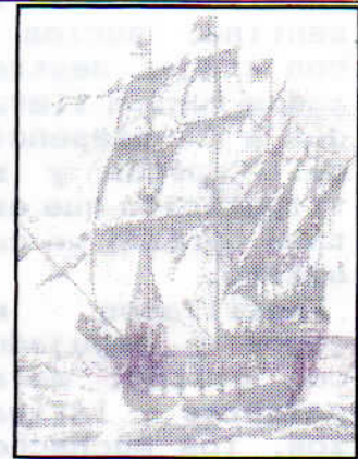
Galeón inglés "Great Harry" ( 1550 )

A la tentación de un succulento curanto, el rancho fue delicioso, aunque hubo reclamos justificados de desabastecimiento de pólvora.