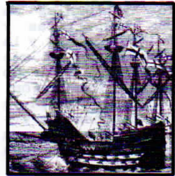
Harry Grace-à-Dieu con 184 cañones S i g l o X V I

Posteriormente se congregaron en la segunda cubierta y