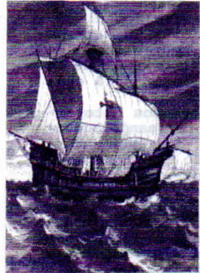
Carabela española Siglo XV