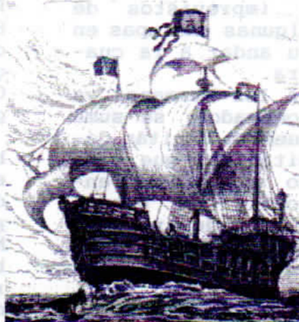
Carabela año 1400

El presente consiste en un antiguo e histórico clavo con que se construyera el fuerte.