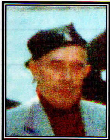
Capitán Nao Valparaíso Capitán Nao Talcahuano