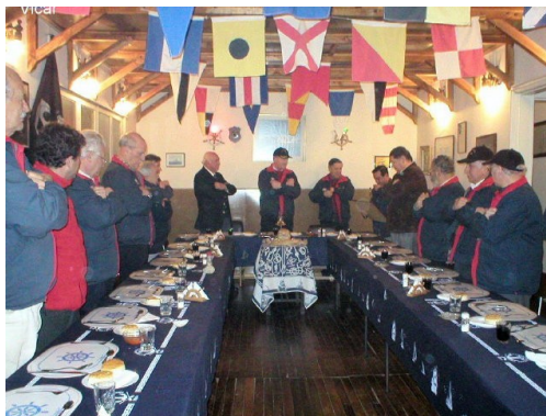
Una vista de la cubierta 2 en el momento de la lectura del Octálogo