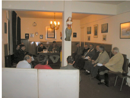
Los hermanos de la Nao en reunión abierta de oficiales