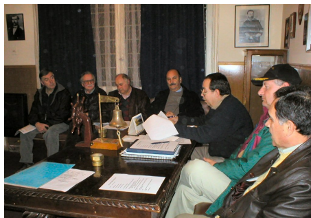
El Capitán, LT. y Escribano presiden la reunión

El toque de la campana indica el término de la reunión y el momento de pasar a la cubierta 2, en donde espera un buen buacán preparado por el Mayordomo y sus muchachos y bichicumas.