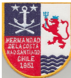
Insignia de la Nao Santiago