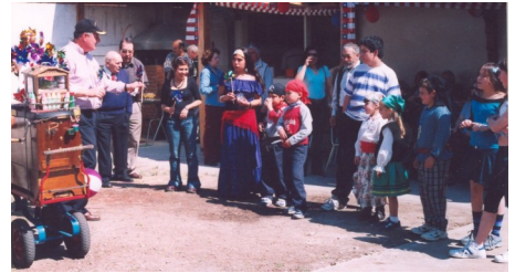
Los escualos y sirenas y un organillero junto al Capitán

El Trovador de Oro sacó a relucir su guitarra y lanzóse a entonar todas aquellas canciones marineras del gusto de la nao. Los hermanos y cautivas corearon a voz en cuello las melodías, algunos más entonados que otros.