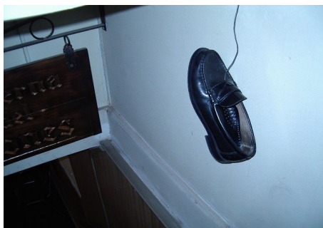
Misterioso zapato aparecido en el acceso a la Taberna El Olonés en el último zafarrancho.

Gracias, Capitán, por esta preocupación por los hermanos de la Nao.