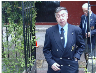
El hermano Chilote entrando a la guarida.

Recuerda especialmente su paso de bichicuma a muchacho y el enganche como hermano en Punta Angamos.