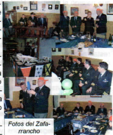
Fotos del Zafarrancho

Ya entrada la noche, previos cañones de pólvora rubia para orzar, se tomaron las fotografías de rigor para dejar constancia de este excelente y fraternal zafarrancho, que hará historia en nuestra Nao.