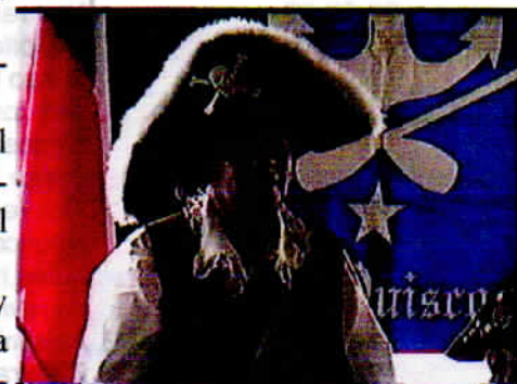
Capitán Bronco. Nao El Quisco

Mucha alegría, premios y fraternidad en tan numerosa y variada tripulación, un éxito total.