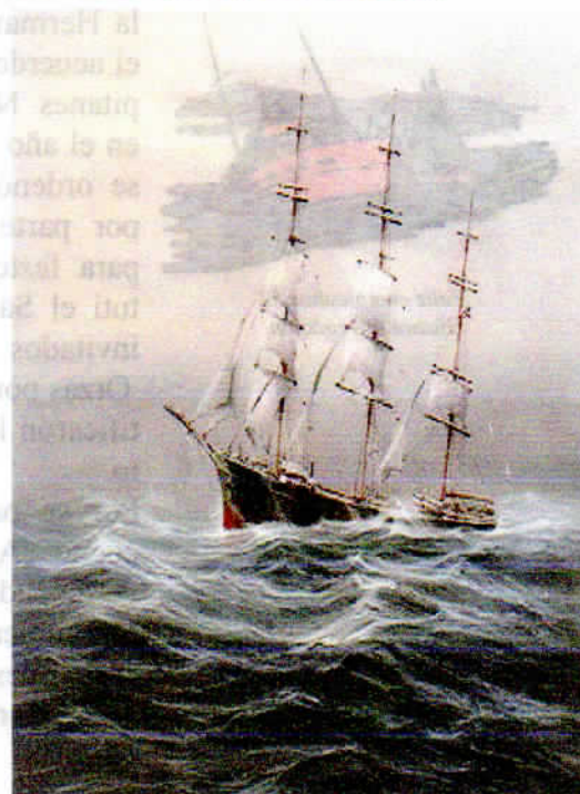
barca RICKMER RICKMERS, buque-museo de Hamburgo, uno de los grandes veleros que recuerdan a los alemanes la gloriosa época de la na- vegación por la ruta del Cabo de Hornos.

En fin, otra inolvidable fiesta de zafarrancho, adornada con las cautivas.