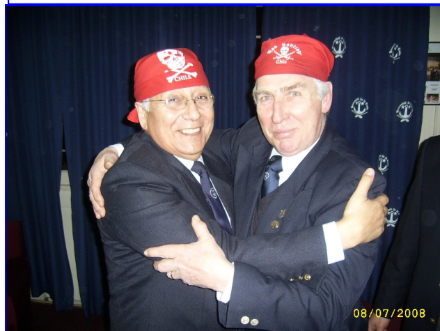
Conocido el resultado, el Capitán Le Gascón felicita al nuevo capitán Avispón Verde

ron esta actividad, la más importante en una Nao, además de los deseos de viento a un largo y mucha agua bajo la quilla. Un succulento cóctel rubricó el acto eleccionario, en donde los hermanos dieron rienda suelta a sus emociones ante el nuevo capitán. El Santiaguillo también hace orzas por el Capitán recién electo.