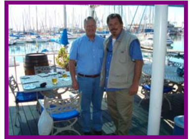
Euzkaro y Ruthless, en el RCYC

El city tour terminó en el Royal Cape Yacht Club (RCYC), donde después de degustar uno de los exquisitos pescados de la zona, junto a una refrescante cerveza, los esperaba la tripulación del yate "Shazam" al mando de su Capitán Neil Hoffmeyer. Hubo tiempo para unas tres agradables horas de navegación y de ahí nuevamente al aeropuerto para el regreso a Johannesburgo. Fue un día muy agradable, donde hubo la oportunidad de conocer a los Hermanos de Sudáfrica y las actividades que desarrolla la Mesa Saldanha. Muchos fueron los saludos escritos y telefónicos, que recibió el hermano Euzkaro, de los Hermanos de Sudáfrica y Angola, que no pudieron estar presente ese día con él.