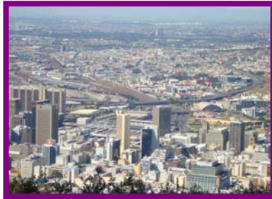
Una panorámica de Cape Town