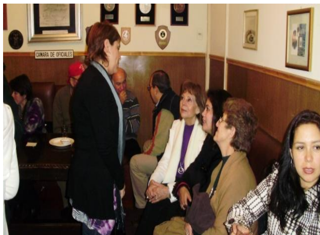
¿Cámara de oficiales o de cautivas?