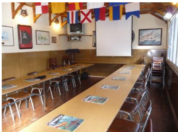
Sala multiuso en la segunda cubierta