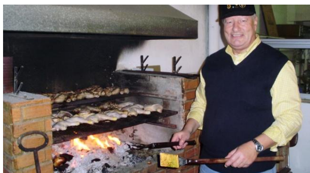
Quincho y el dueño del quincho