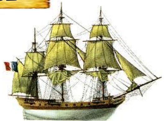
Bergantin francés, 1793