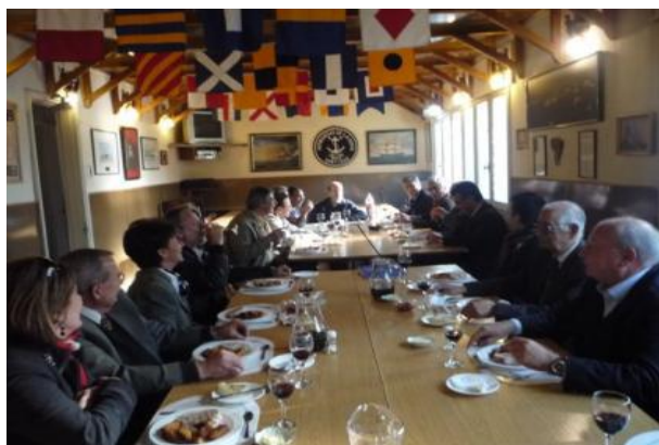
Un condumio cualquiera