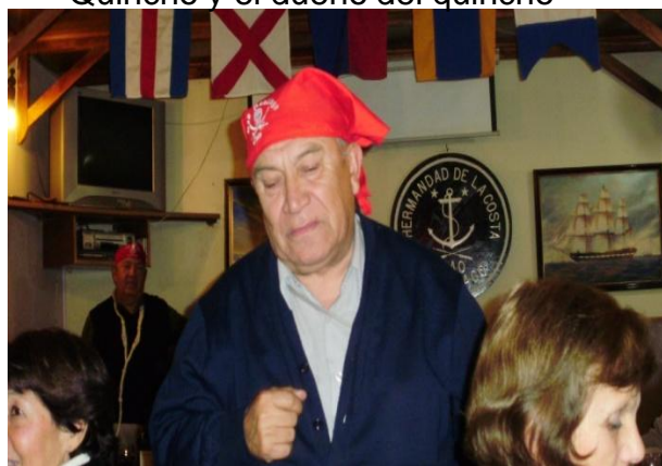
¿Dónde dejé a mi cautiva?