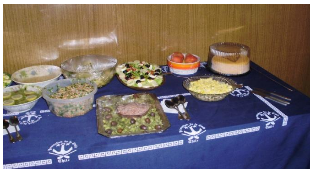
Boucán "tente en pié"