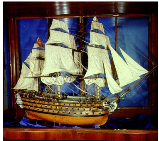
Modelo de un navío español de tres puentes y 140 cañones del s. XVIII