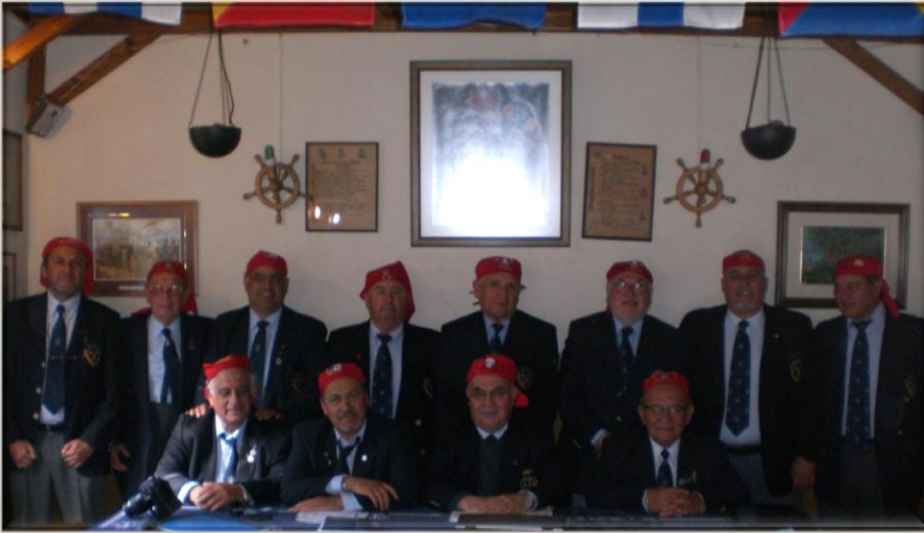
Foto oficial de los honorables miembros del Consejo de los XV reunido el 6 de abril en la guarida de la Nao Santiago