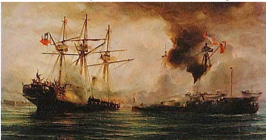
Thomas Somerscale Combate Naval de Iquique

Germano Editor yrrresponsable del Santiaguillo