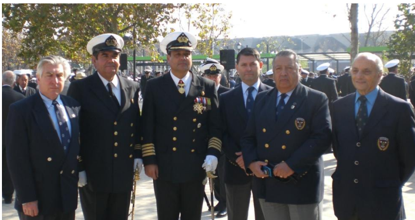
Con el comandante de la Estación Naval Metropolitana CN Aimone