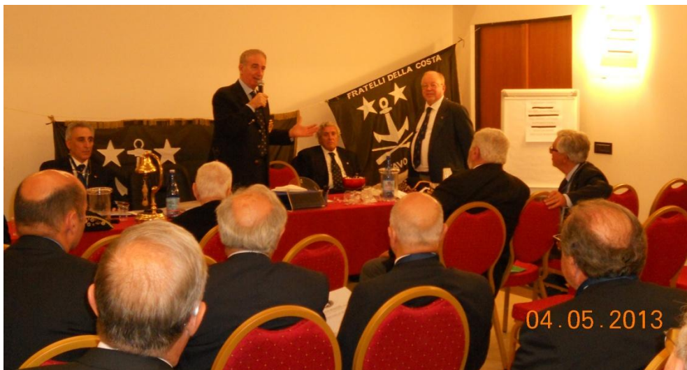
Tanganikajack in piedi in fondo alla destra