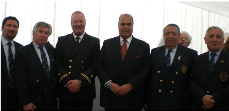
Con el Hermano en travesía Jarula

El cóctel fue amenizado con marciales y tradicionales canciones de los Cuatro Cuartos. El Hermano Le Gascon no pudo resistirse y fue a saludarlos personalmente