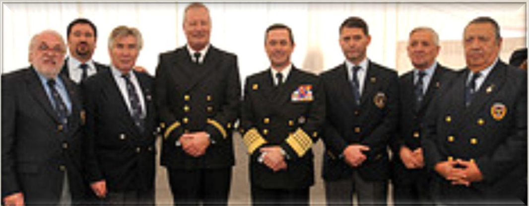
El Almirante y los Hermanos

.... Y las autoridades también tuvieron su momento de intimidad para expresarse sus mutuos sentimientos de cariño, amistad y fraternidad. ¡Qué bonito!!!!