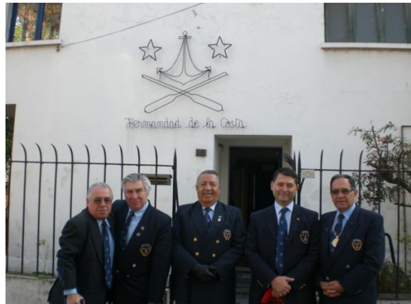
Parte del piquete antes de zarpar al homenaje