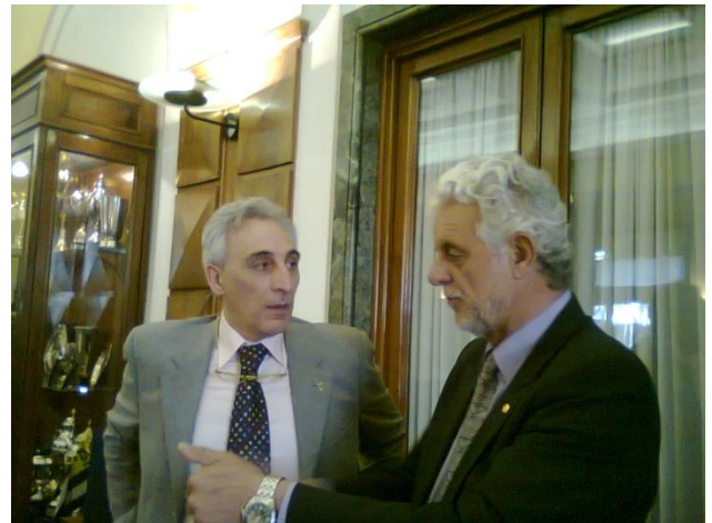
Gran Comodoro a la derecha