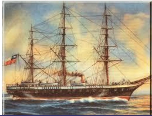
Imagen de la Esmeralda, hundida en la rada de Iquique el 21 de mayo de 1879