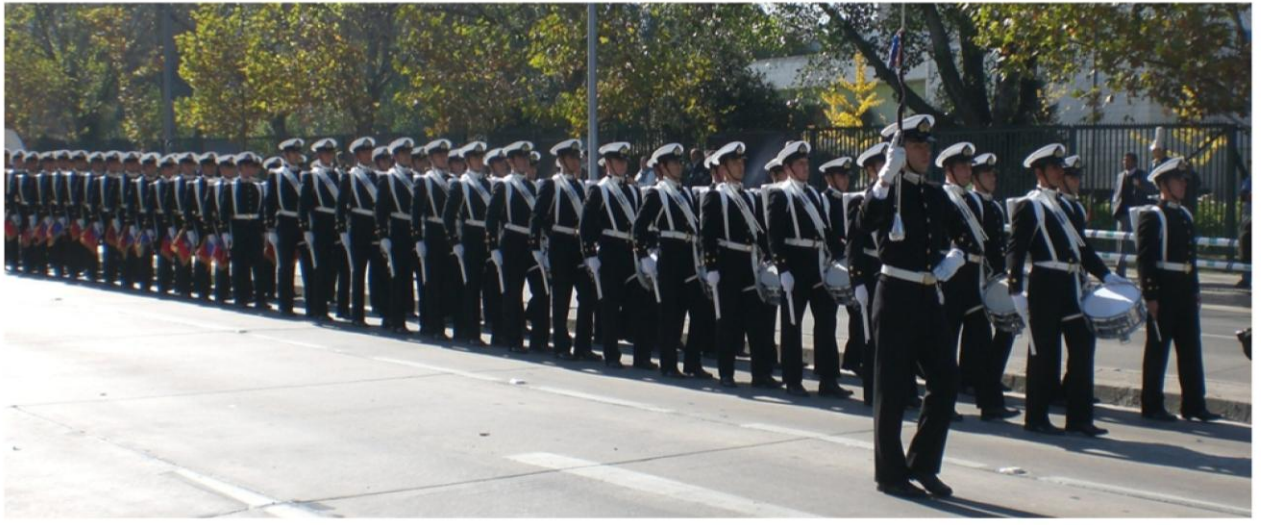
La banda de guerra de la Escuela Naval tratando de encajonarse en las calles de Vitacura

Fue emocionante y muy diferente escuchar a las trompetas a una muy corta distancia de nosotros.