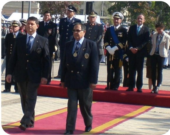
Capitán Puelche y LT Vulcano