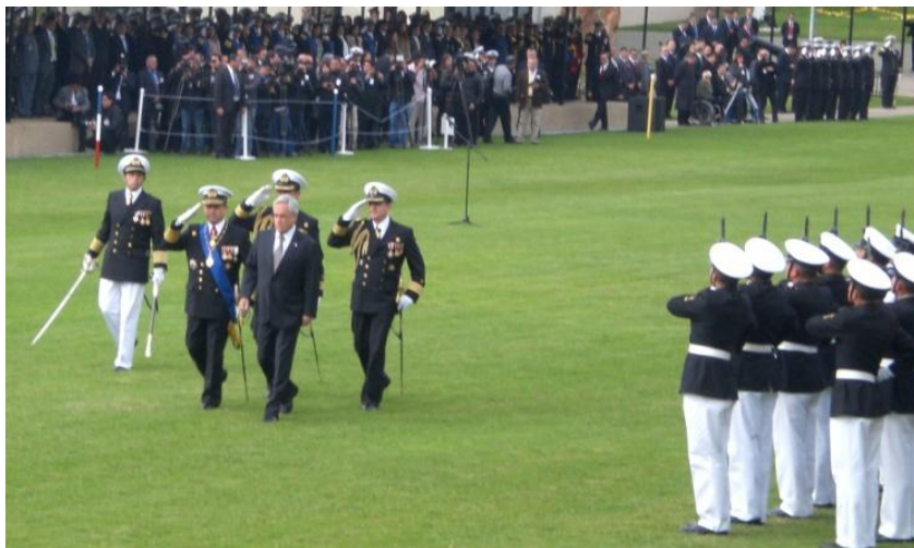
S.E. pasando revista al escuadrón de formación