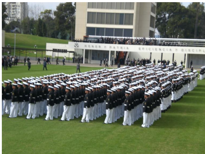
Formación en el patio de la Escuela Naval