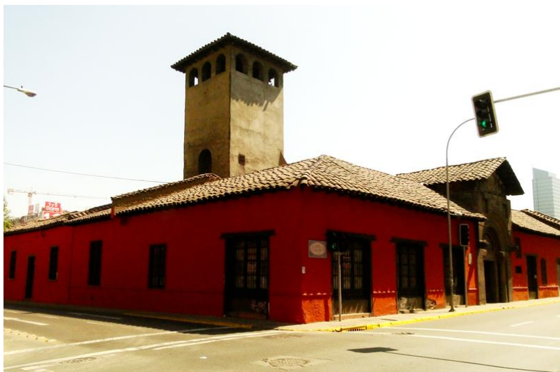
Desde 1997 esta casa es monumento nacional.

Su estilo fue modificado por artistas del mismo grupo, terminando en un estilo neocolonial.