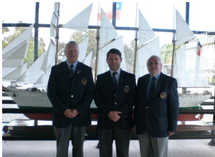
La Hermandad de la Costa en el pórtico de entrada a la Escuela Naval