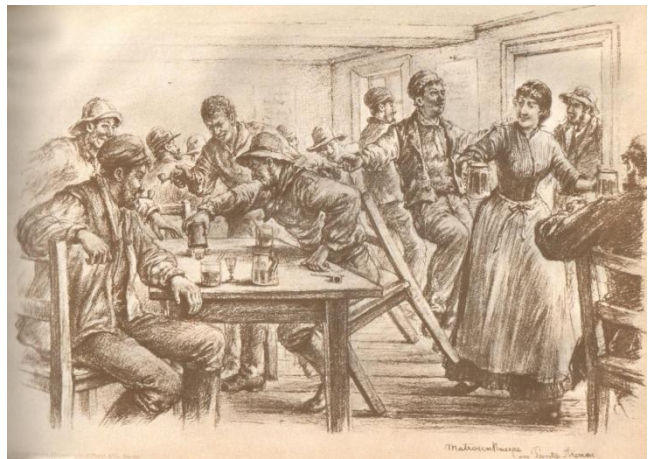
Una taberna en Punta Arenas

Theodor Ohlsen, el autor de este dibujo, nació en Klein-Brebel, Alemania en octubre de 1855. Llegó a Chile en 1883 y recorrió diversos lugares del país captando expresivamente en dibujos a carbón y pluma las mas variadas escenas y personajes de Chile que las incluyó en un álbum que tituló Durch Sud Amerika , impreso en Hamburg en 1894. Se trata de una obra muy poco conocida, joya de bibliófilos y de notable valor histórico costumbrista, según Mateo Martinic.