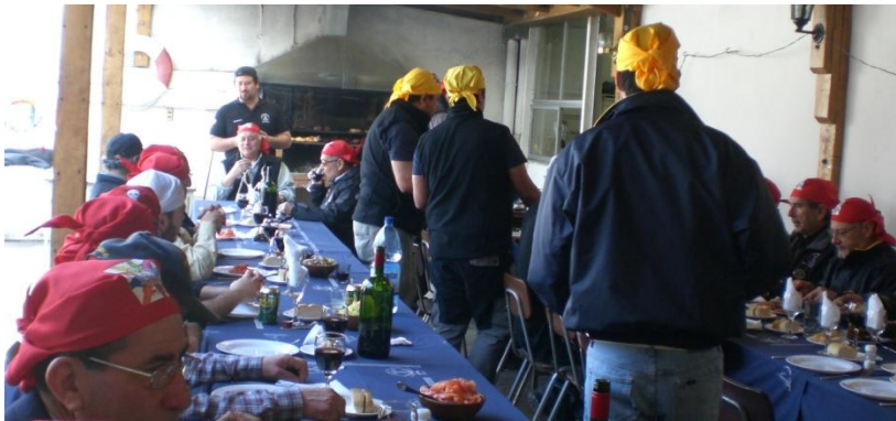
Los bichicumas haciendo méritos