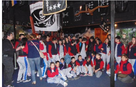
En la sala de la Hermandad de la Costa