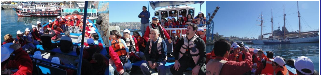
Paseo en lancha por la bahía de Valparaíso y vista de la Esmeralda