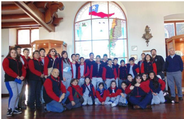
En el Museo Marítimo