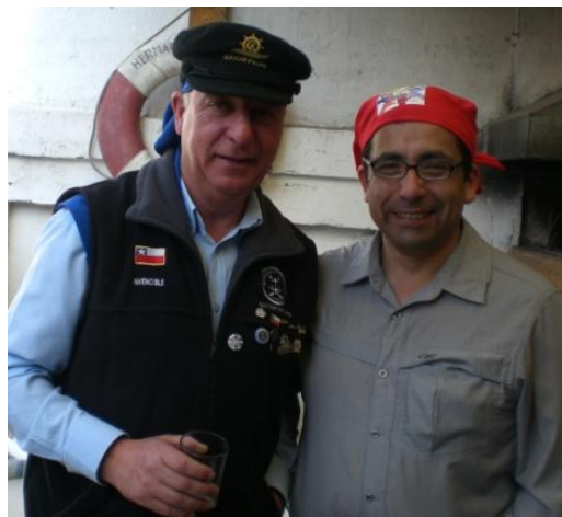
San Antonio y Punta Arenas juntos