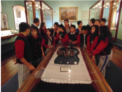
Uniforme de Prat