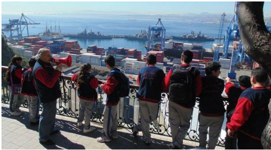
Vista del puerto en paseo 21 de Mayo