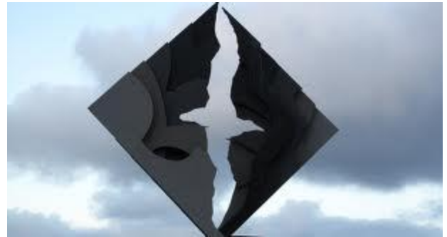
Escultura Albatros en el Cabo de Hornos

Apreciados lectores: Estamos contentos, no sólo porque pasamos el mes de agosto, sino que además hemos tenido actividades que nos llenan de orgullo: el viaje a la costa premiando a alumnos de un establecimiento educacional santiaguino y haber realizado el Zafarrancho de la Fraternidad. De ambos temas les mostraremos muchas imágenes. Aprovecho de agradecer a mi colega y Hermano TBC el magnífico artículo publicado en Abordajes N°79 que me ahorra repetir los acontecimientos ocurridos en el zafarrancho de la Fraternidad. Nuevamente hay un artículo sobre el cambio climático, otro sobre insignes navegantes y nuevos antecedentes sobre la pesca recreativa. Ojalá les guste este nuevo boletín. Orza Hermanos!!!!!!