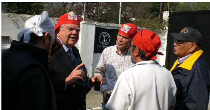
Hay que escuchar atentos al CN Blood