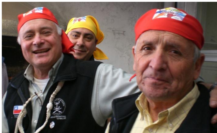
¿Qué hace ese bichicuma entrometido?