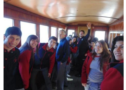
Bajando en funicular