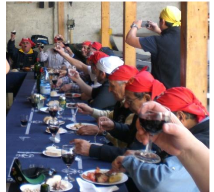
Un orza, contra maestre, ha ordenado mi Capitán!