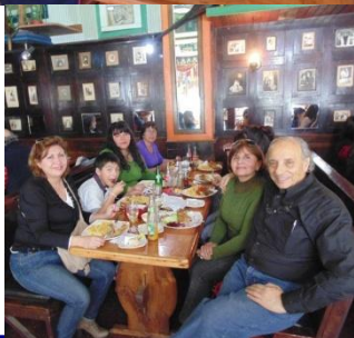
Al fin un reponedor almuerzo en una taberna porteña