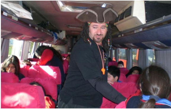
A Z l g a r d e t e