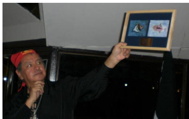
El Germano con la caña y el Capitán Cook mostrando el regalo de la Nao Santiago