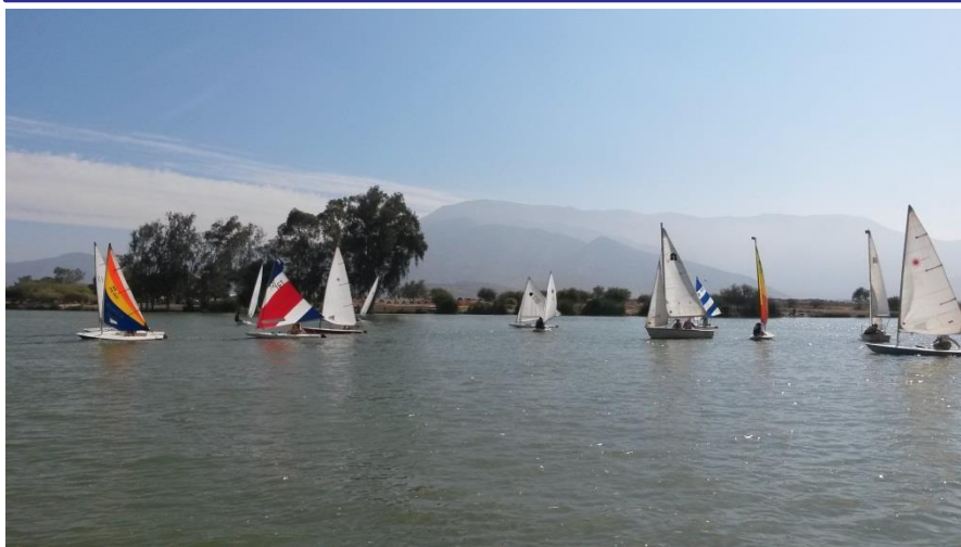
Veleros compitiendo en la laguna Caren

El Club de Yates Caren y la Nao Santiago están creando una alianza estratégica que por cierto beneficiará a ambas instituciones. El club guardará sus trofeos en nuestra guarida y también celebrará sus reuniones de directorio y asambleas en nuestra institución. A su vez los tripulantes de la Nao podrán ir a navegar sin mayores condiciones a la laguna Caren y competir en las actividades deportivas que desarrolla este club. De hecho a mediados de abril el club tiene programado realizar una regata Copa Hermandad de la Costa, en homenaje al aniversario de nuestra nao y de nuestra cofradía. Una buena iniciativa que permitirá acrecentar la actividad deportiva a vela en nuestra región.