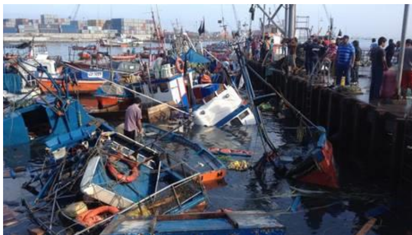
Caleta Guardiamarina Riquelme en Iquique