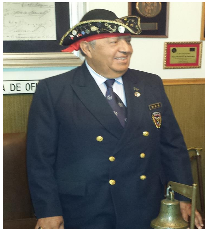
Flamante nuevo Capitán Cormorán