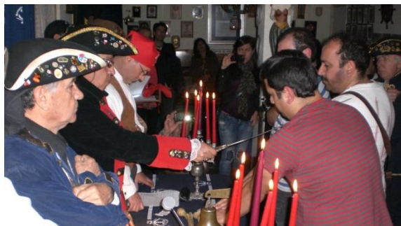
Colocación de pañoleta y juramento