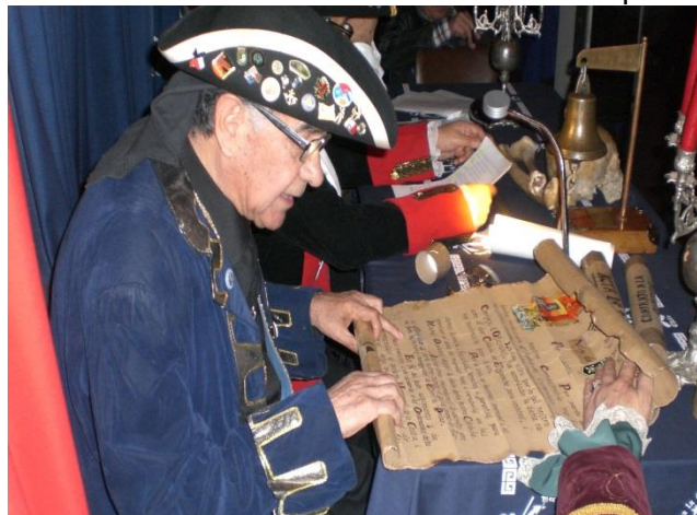
El veedor lee el acta de enganche