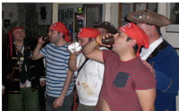
Degustando un pernil y un copón de ¿ron?