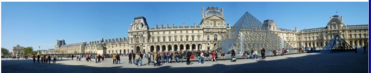
Museo el Louvre, Paris