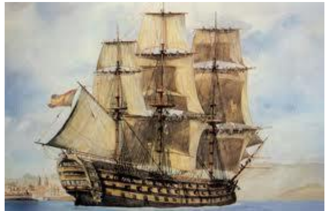
Navío español de 112 cañones