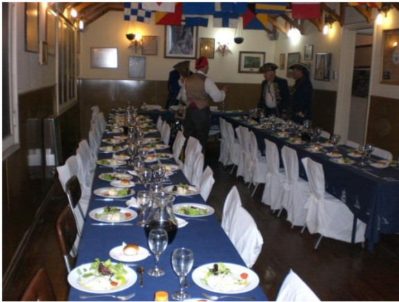
La segunda cubierta espera la llegada de la tripulación