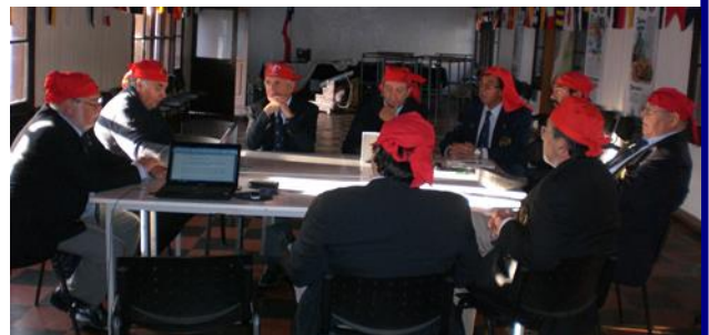
Los Consejeros de los XV también aprovecharon la ocasión para tener su propia reunión