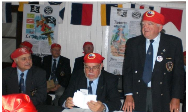
Verificando la votación