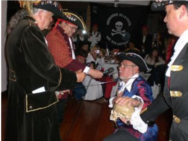
Juramento de McGiver