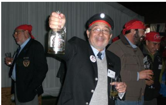
Mini celebración del CXV