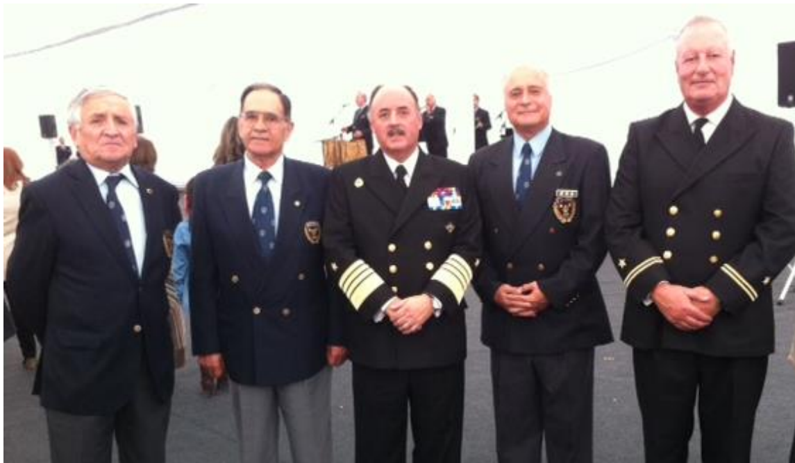
Zalagarda, Vulcano, almirante Larrañaga, Toscano y Euzkaro