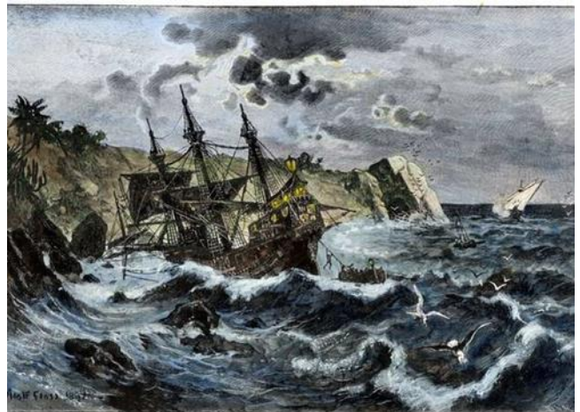
Nafragio del Santa María en la costa Hispañola