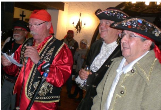
Ajut leyendo un relato de su travesía marítima cruzando el Atlántico, puerto Williams, puertos chilenos y ahora rumbo a Tahiti