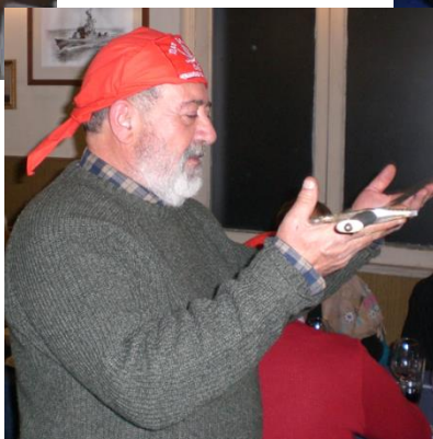
El hermano Lula