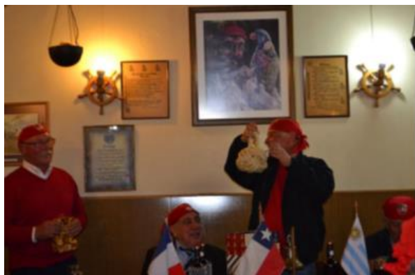
Ajut, Loro y Toscano con su cabeza de turco

Zafarrancho con el piquete de hermanos uruguayos