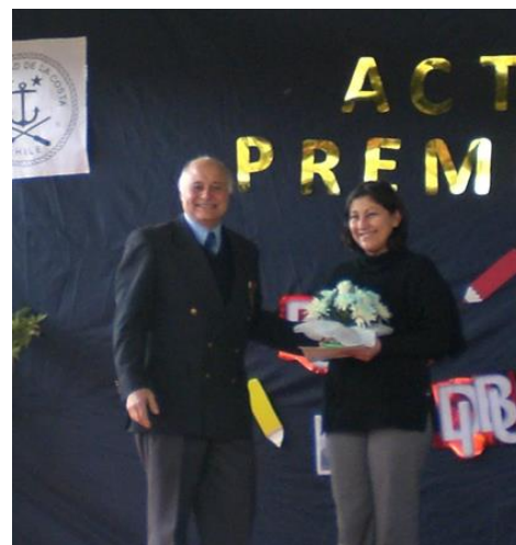
Un premio especial