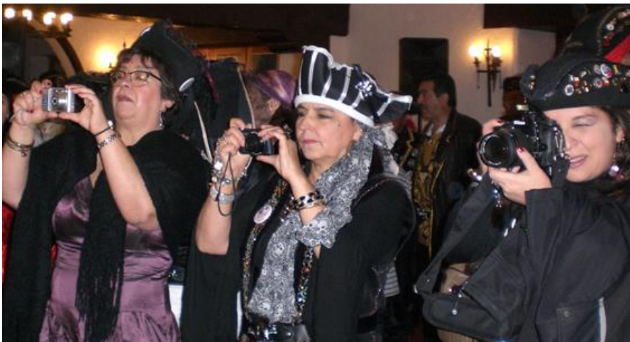
Prensa local, nacional e internacional cubriendo el evento