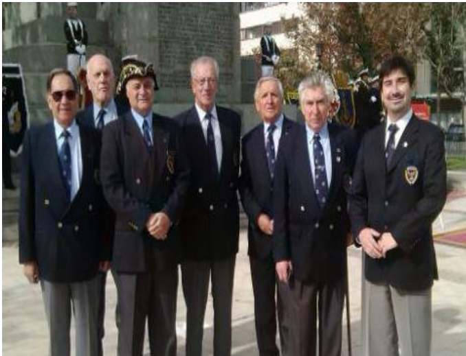
Vulcano, Tronador, Toscano, Vikingo, Zalagarda, Le Gascogne y Enfachado posando a los pies del monumento a Prat