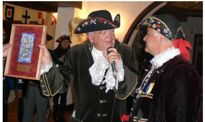
Mostrando el regalo de la nao Santiago (Grabado del hermano Scirocco)