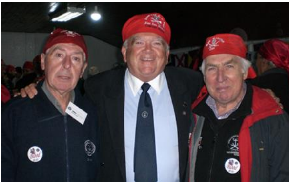
Chilote, Blood y Le Gascogne