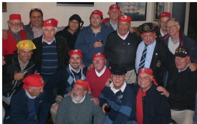
Hermanos uruguayos, francés y chilenos en un fraternal abrazo