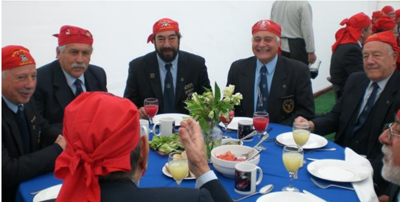
Almuerzo sin pólvora