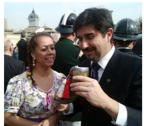
Enfachado sacándose fotos de la ocasión y orzando con una gasita