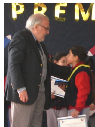
Los jurados Vulcano, Scirocco y Germano premiando a los mejores concursantes