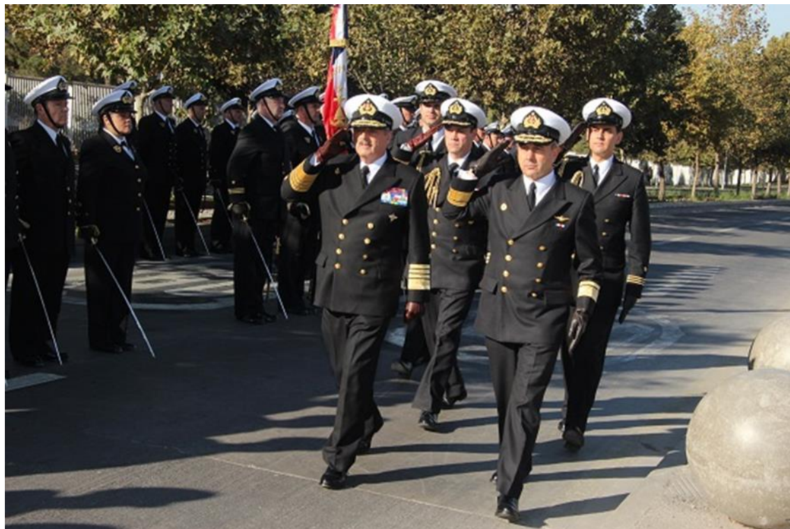
Almirante Larrañaga y CA Undurruga pasando revista a las tropas