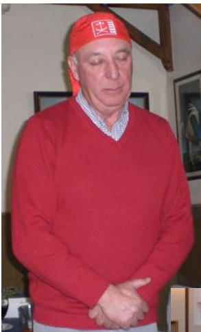
Ejemplo de humildad