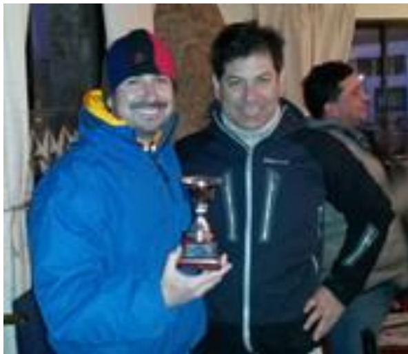
Enfachado y el bichicuma Asolas