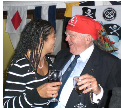
Si las miradas hablaran