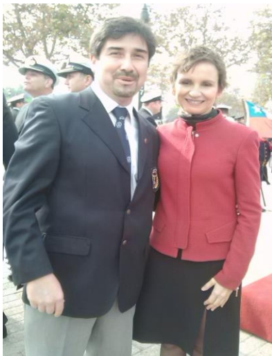
Con la alcaldesa de Santiago Carolina Toha