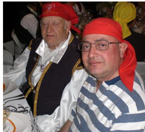
De puerto Williams!!