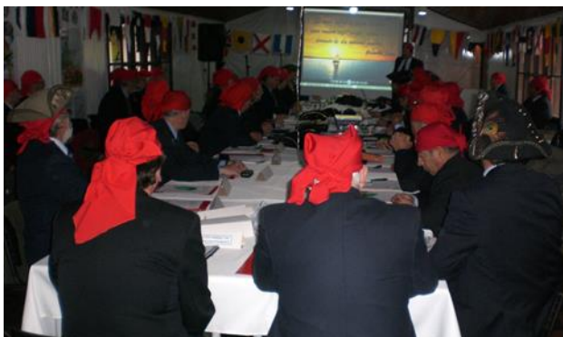
Asambleístas viendo videos