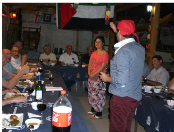
La cautiva Yasmín en la noche palestina