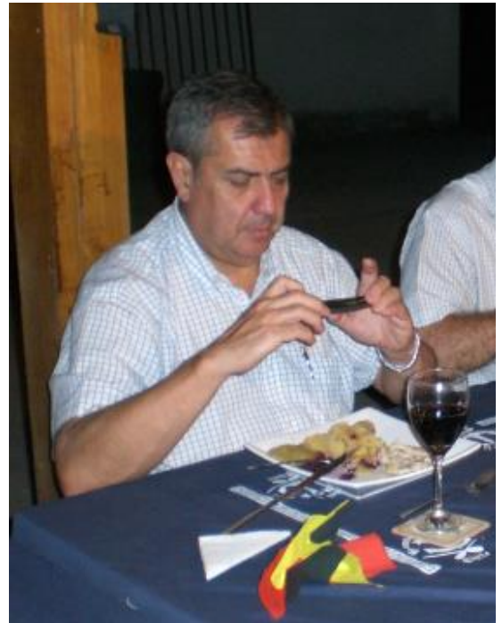
Cid Campeador fotografiando su bucán