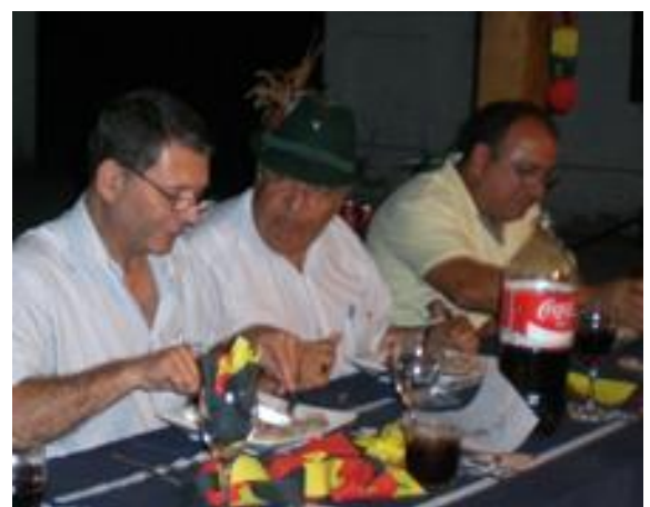
Cormorán muy tirolés en la noche germana