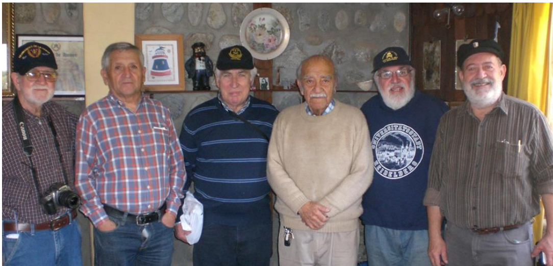
Scirocco, Zalagarda, Le Gascogne, Turco, Germano, Lula