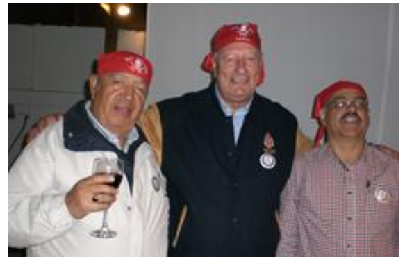
Cormorám, Euzkaro y Potro