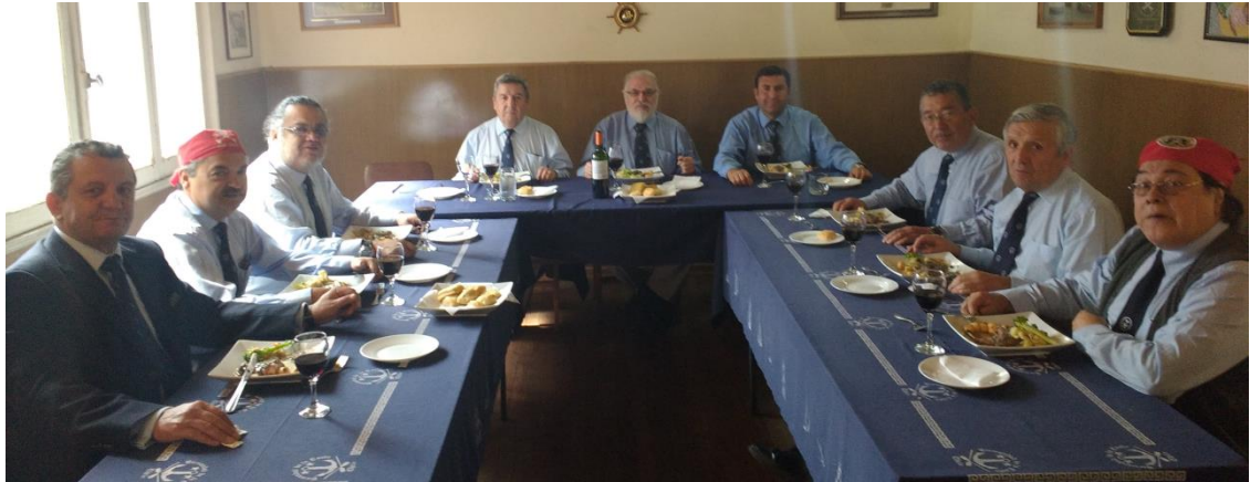
Pirata Neruda, Fatiga, Pituto, Ventura, Germano, Espadachín, Choro, Zalagarda, Besugo

El sábado 2 de abril se realizó la tercera reunión del Consejo de los XV en la guarida de la nao Santiago.