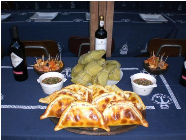
Condumio en el festival de la chilenidad