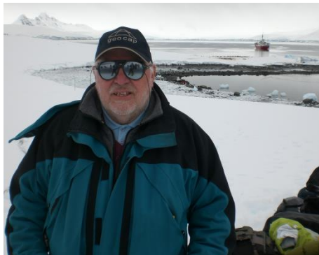
Germano en la Antártica

El 15 de julio de 1955 el gobierno chileno rechazó la jurisdicción de la Corte en ese caso y el 1 de agosto lo hizo también el gobierno argentino, por lo que el 16 de marzo de 1956 ambas demandas fueron archivadas.