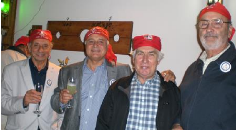
Tano el terrible, Cap Toscano, Le Gascogne y Toñopalo