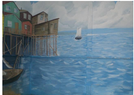
Mural chilote en la Casa Chilota - Santiago

Valerosos y apreciados lectores: Estamos terminando el año 2016 y cada uno de nosotros detiene su andar para hacer un recuento de los acontecimientos transcurridos en este periodo de tiempo. Seguramente la partida de algún Hermano o familiar querido nos hará revivir momentos tristes pero reafirmamos nuestra convicción de que nunca los olvidaremos. En nuestras naos hemos debido enfrentar temporales y mares calmos. Pero nuestros capitanes han sabido mantener el rumbo y llevarnos a un buen puerto. El amor al mar, el Octálogo y los sabios principios que nos legaron los hermanos fundadores han sido la luz que nos ha guiado en esta singladura. Vaya para todos ustedes, queridos lectores de este boletín, un fraternal quiebra costillas, con los mejores deseos de una navegación con buenos vientos, mucha agua bajo la quilla, en la unión con sus cautivantes cautivas, sirenitas y escualos, así como también a los queridos tripulantes de la nao Santiago y de las otras naos del litoral y del extranjero que leen este boletín.