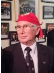
Hno. Minor GUAITECAS Braniff Nao Santiago

Con motivo de recordar el día del buzo, quiero rendir un homenaje a esos buzos de Chiloé que, en la segunda mitad del siglo pasado ejecutaron este oficio, no como deporte, sino que como medio de subsistencia, oficio que este Hermano de la Costa practicó durante mucho tiempo. (buzos de escafandra)