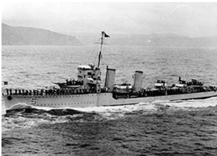
Destructor Serrano.

En la imagen los tubos del cañón están cubiertos con una funda de lona, lo que delata su latente grado de operatividad, que por lo tanto representa la amenaza argentina de la época.