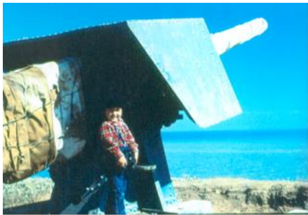
Uno de los dos cañones Vickers Armstrong de 4,7/45 (120 mm) de origen inglés, fotografiado en la década de los '80 en el sector Panul, San Antonio.