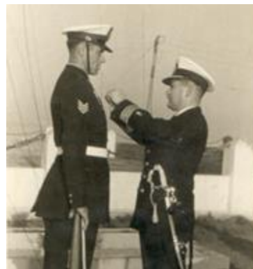
Ceremonia de premiación en Gobernación Marítima de San Antonio. 1962.

En el ocaso del fuerte Panul, estuvo un año viviendo solo, sin más personal naval que su familia, hasta que la base fue totalmente desmantelada.