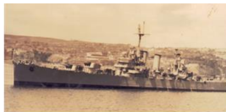
Crucero ligero Capitán Prat en Valparaíso en 1953.