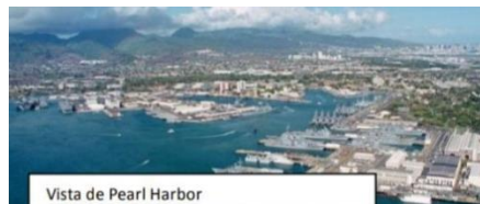
Vista de Pearl Harbor