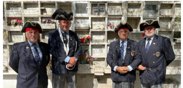
El recuerdo respetuoso a los Hermanos que navegan en el Mar de la Eternidad y el enganche de nuevos Hermanos van uniendo el hilo de la historia de la Cofradía.