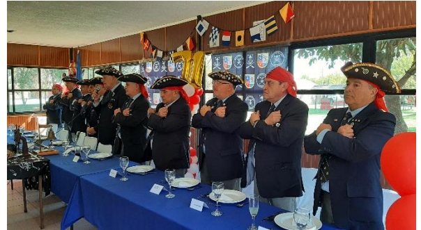
Un aspecto del Zafarrancho 71° Aniversario, que muestra el puente de mando con el Capitán Nacional y los Capitanes de Naos del Litoral.

El contenido de los artículos publicados en este boletín es de exclusiva responsabilidad de cada autor.