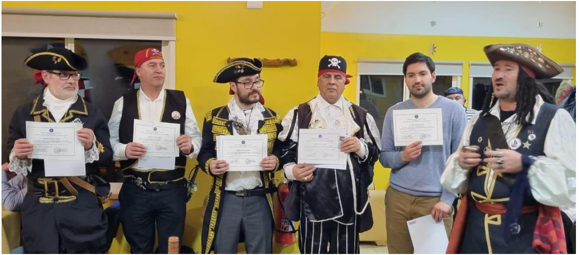
Tripulantes de la Nao Porvenir, Patrones Deportivos de Bahía, luego de recibir las licencias que los habilita como tales.

El Director de la Escuela Náutica y Capitán de la Nao Santiago, dispuso que el LT ALGARETE cumpliera la grata misión de hacer entrega de sus licencias de Patrón Deportivo de Bahía a los Hermanos de la Nao Porvenir que fueron alumnos del Curso PDB65. En tanto, en nuestra guarida fueron entregadas las licencias a 3 egresados del mismo curso. Orza y buen navegar!!!