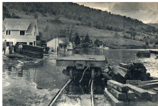
LAS AGUAS DEL LAGO penetran en el interior de la estación de la localidad de Riñihue. Palmo a palmo todo va quedando bajo el manto líquido, que avanza en forma arrolladora.

El 21 de julio el agua se pone turbia y continúa subiendo, ya se puede prever para pocos días mas el desborde, según el plazo fatal dado por los profesionales de Endesa y Corfo. Crece la angustia entre los habitantes, con dos meses pasando infinita incertidumbre y temor.