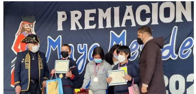
Foto superior, ceremonia de premiación del Concurso Cultural Mes del Mar, en el Saint Charles College. Foto inferior, Asamblea Nacional de Capitanes, realizada en la guardia de la Nao Santiago.