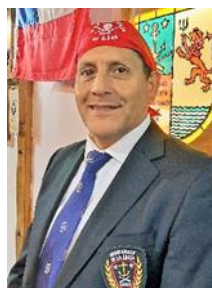
BARRACUDA V Pañolero