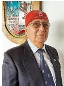
AVISPON VERDE Cirujano Barbero