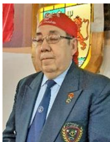
CORSARIO ESCARLATA Lenguaraz