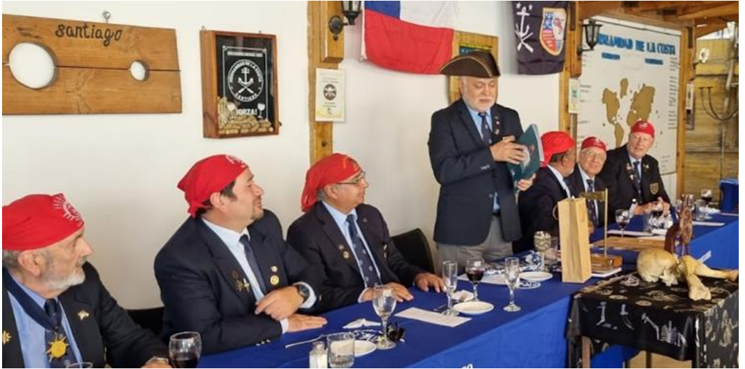
Hermanos TOÑOPALO, Nao Chicureo, ALGARETE, LT Nao Santiago, GRILLETE, Capitán Nao Valparaíso, JACK, Capitán Nao Santiago, SALVAJE, Capitán Nao Valdivia, AVISPÓN VERDE, CXV, y EUZKARO, Veedor de la Nao Santiago.