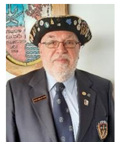
EL GERMANO Vigía RRPP