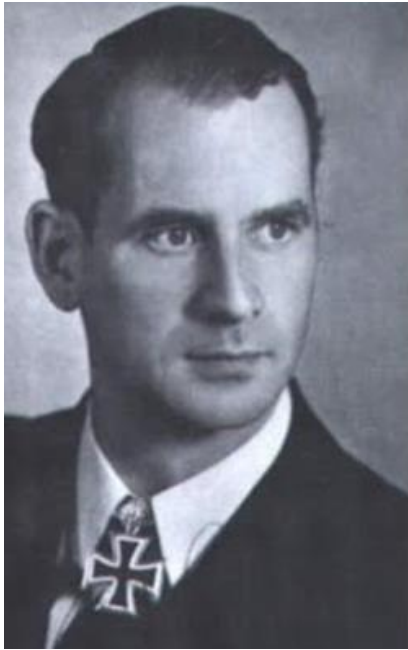
Otto Von Bulow Capitán del submarino alemán U- Bote 404, que hundió al "Toltén" frente a la costa estadounidense.