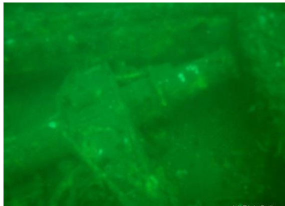
Restos sumergidos del Toltén

En la noche del 12 de marzo de 1942, un grupo de submarinos almenas había atacado con éxito la costa estadounidense, logrando hundir a 25 buques enemigos en unas semanas. La navegación para los buques y reconocidas por los beligerantes, era navegar con las luces encendidas durante la noche y tener la bandera de su país neutral a la vista. Sin embargo, el Capitán Aquiles Ramírez aquella noche dio la orden de apagar las luces convirtiendo al buque mercante en un potencial blanco de los alemanes y entre las 2 y 4 de la mañana y madrugada del viernes 13 de marzo de 1942, una fuerte explosión sacudió al Tolten por el costado de babor y que en ese momento se encontraba a unos 27 kilómetros de la costa de Nueva York. La nave chilena fue torpedeada y se partió en dos con la fuerza de la explosión, lanzando al mar al fogonero Julio Faust Rivera, quien logro subir a una balsa vacía del buque. El Tolten se hundió en menos de seis minutos no dando tiempo a la tripulación para sacar los botes salvavidas, muriendo ese día 27, de los 29 tripulantes. En la actualidad los restos del buque son visitados a menudo por buceadores que hacen turismo en el lugar.