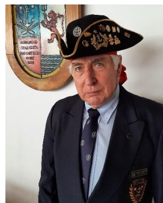
VLM Armando L'GASCOGNE Cammoueight Marticorena Rol 1264