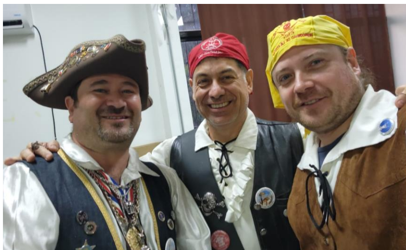
Hnos. ALGARETE y CHINCHINERO y el Bichicuma HAMMER