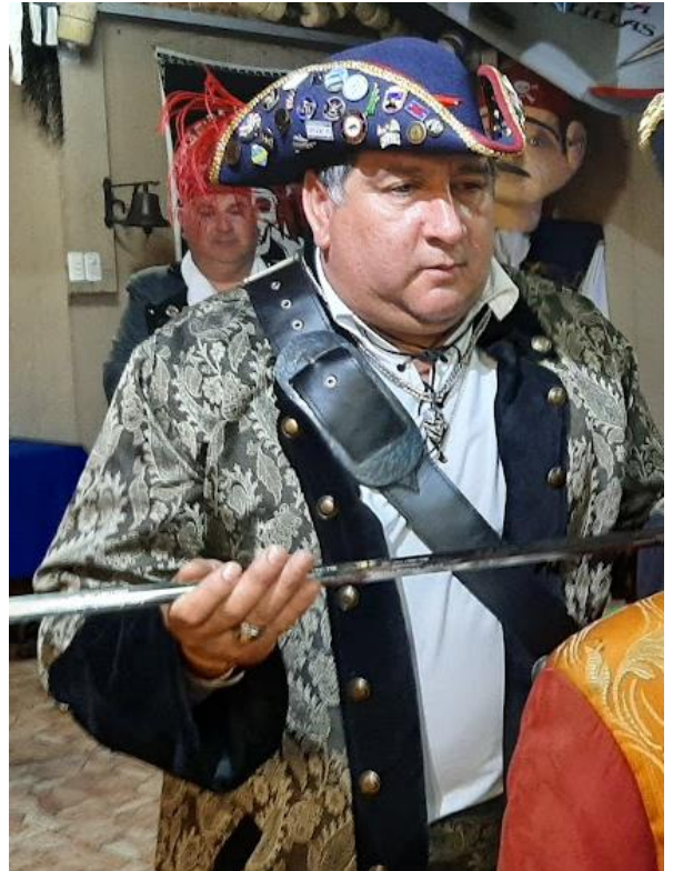
El Capitán Nacional SIMBAD asume el mando de la Hermandad de la Costa de Chile y nombra Oficiales Nacionales

El contenido de los artículos publicados en este boletín es de exclusiva responsabilidad de cada autor.