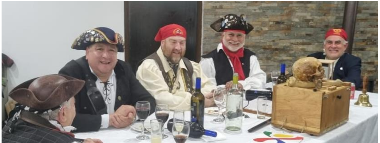
El Hermano VLM HALCÓN, Escribano de la Nao Valdivia, el Capitán Nacional SIMBAD, el Capitán MEGALODONTE, de la Nao Valdivia, el Capitán JACK, de la Nao Santiago, y el Capitán DIUQUÍN, de la Nao Concepción San Pedro. Abajo, los hermanos 4P, de la Nao Nueva Bilbao de Constitución, y ALGARETE, de la Nao Santiago, el Capitán Nacional SIMBAD, Capitán JACK y el Hermano PELÚO, de la Nao Valparaíso.