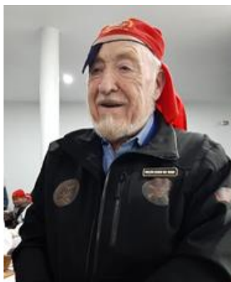
Hno. BARBARROJA, Rol 1402, Condestable, Nao Valdivia.

La “Hermandad de la Costa”, es una Cofradía, derivando del latín su origen, sus integrantes entonces, somos “Cófrades” y así, sin serlo, somos “hermanos”, por antonomasia; tal como el Copiloto, es igual al ... , o es como el Piloto; el Cófrade, es igual al ..., o es como el Hermano, en quién se involucran, confluyen y conjugan variados Conceptos, Valores, Principios, pero sobre todo, Sentimientos de Entrega, Humildad y Espiritualidad.