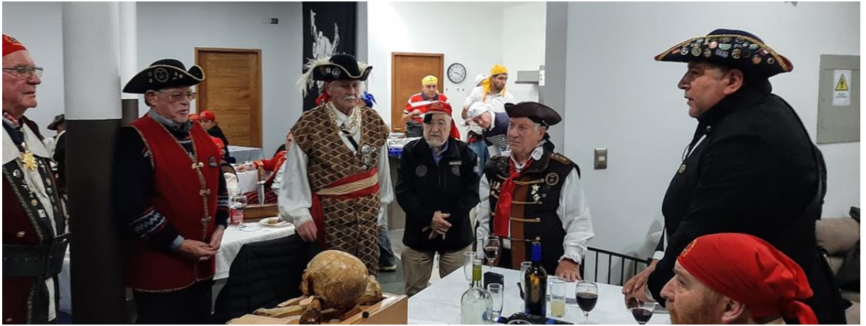
El Capitán Nacional SIMBAD se dirige a los Viejos Lobos de Mar de la Nao Valdivia, a quienes hace un reconocimiento por el acervo histórico y sabiduría de la que son portadores y que entregan generosamente a sus Hermanos