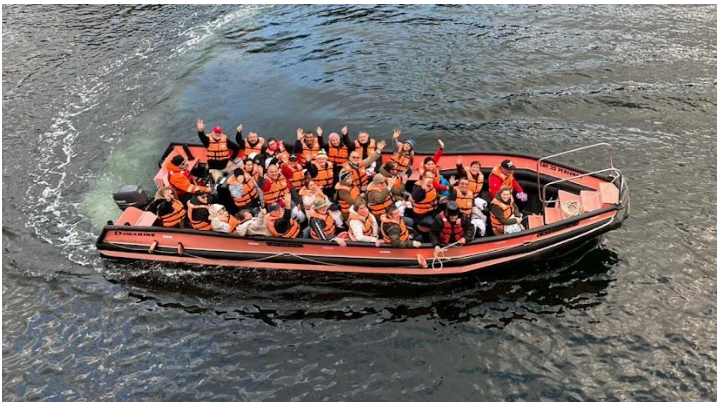
Un piquete a bordo de uno de los botes que se utilizaron para los diversos asaltos a las islas de Chiloé