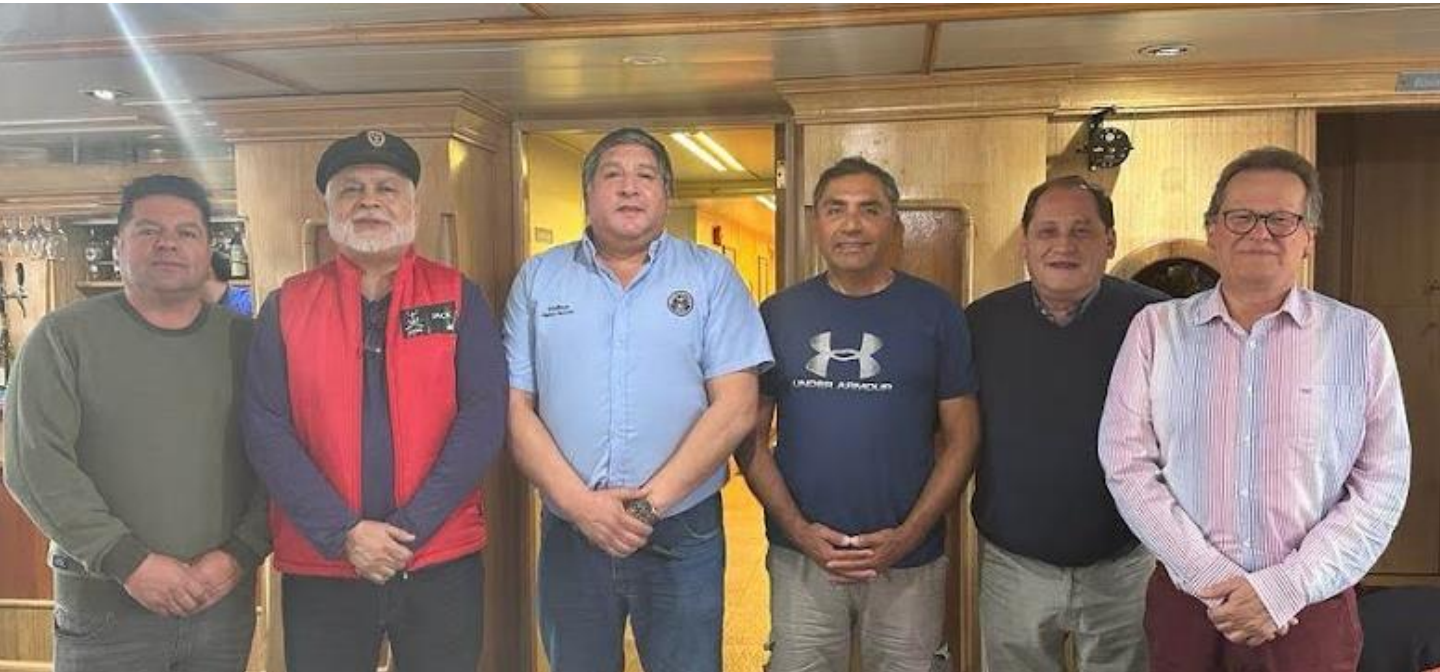
Hermanos BELLACO, Capitán de la Nao Quintero, JACK, Capitán de la Nao Santiago, SIMBAD, Capitán Nacional de la Hermandad de la Costa de Chile, LAPA, Capitán de la Nao Iquique, ESTURIÓN, Capitán de la Nao Copiapó Caldera, y SOBREGIRO, Capitán de la Nao Puerto Montt.