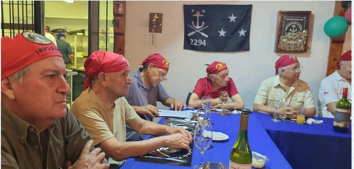
Los Hermanos RAM , de la Nao Chañaral, ZALAGARDA, BARRACUDA V, TANO, AVISPÓN VERDE Y EUZKARO