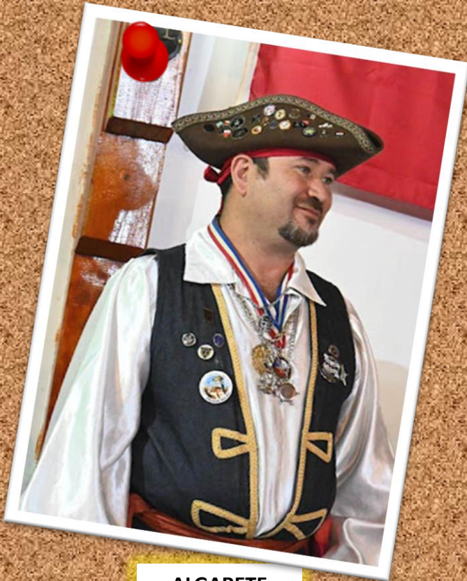
ALGARETE 5 de febrero