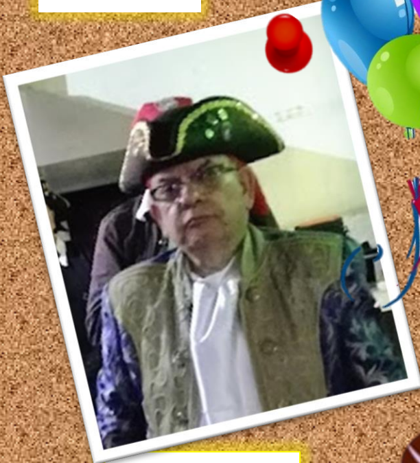
MECHA CORTA 14 de marzo