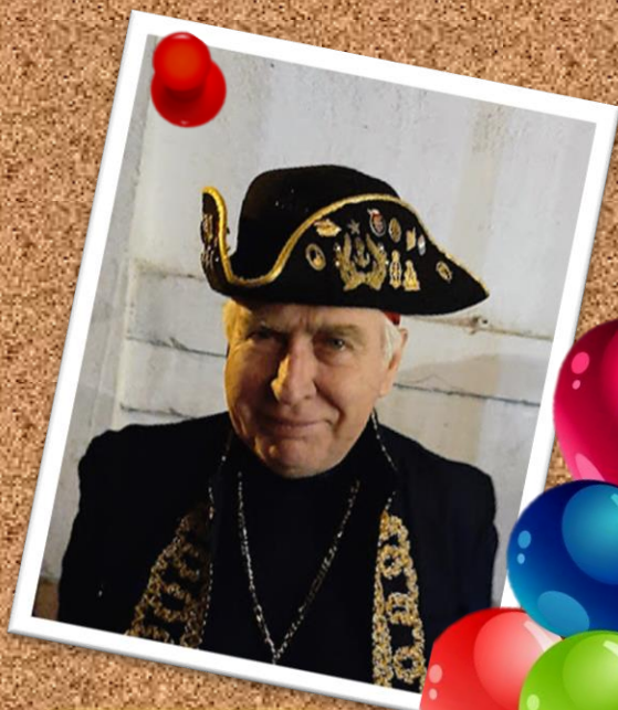
L'GASCOGNE 3 de marzo