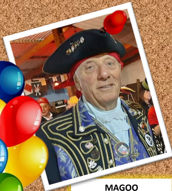
MAGOO 12 de marzo