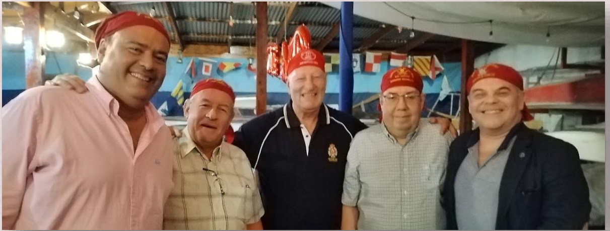
Hermanos DÁLMATO, de la Nao Arica, ARGOS, EUZKARO, CORSARIO ESCARLATA y GRAN RAJADIABLOS, de la Nao Valparaíso.