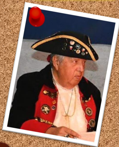
CORMORÁN 22 de marzo