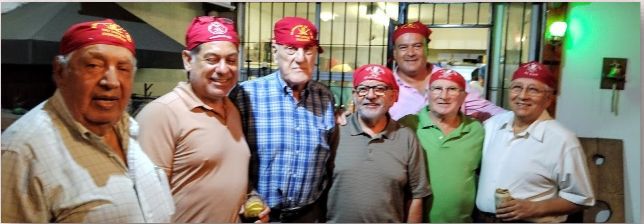
Hermanos CORMORÁN, CHINCHINERO, TRONADOR, MECHA CORTA, DALMATO, GUAITECAS y AVISPÓN VERDE.