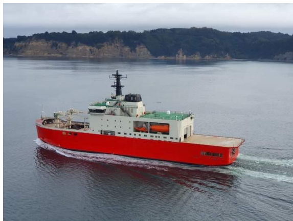
Rompehielos Almirante Viel