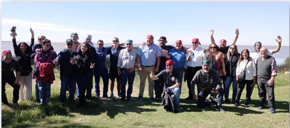
ZAFARRANCHO CALETA RIO DE LA PLATA