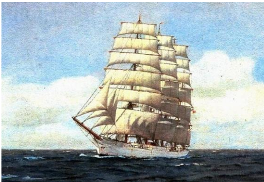
El buque escuela Lautaro

Era un velero Clipper no motorizado que fue reacondicionado en EEUU, se coloca motor y se transforma en buque escuela.