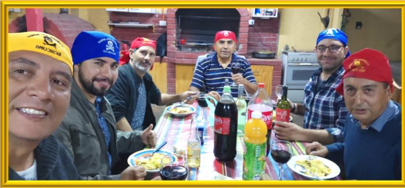
Cámara de Proa para la tripulación menor de la Nao Iquique, en la Guarida del Capitán LAPA

Un piquete de Hermanos de la Nao Valparaíso tuvo la oportunidad de visitar el BE Amerigo Vespucci