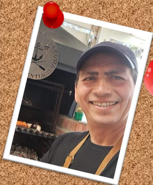
POCOS PELOS 15 de mayo