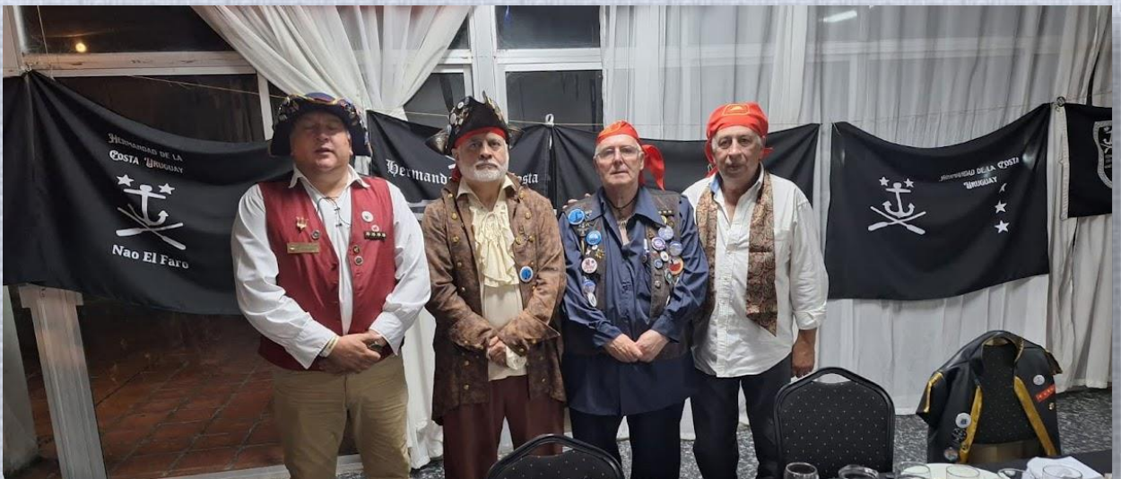
El Capitán de la Nao Santiago junto a los Capitanes Nacionales de Chile, SIMBAD, Uruguay, FREDDY KRUEGER, y Argentina, GUADAÑA