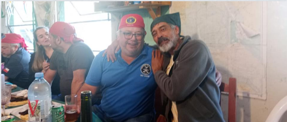
CAPITÁN ALICATE, DE LA NAO CASTRO, EN ZAFARRANCHO DE LA NAO RIO DE LA PLATA