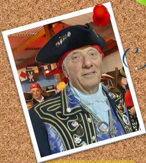
MAGOO 15 de junio