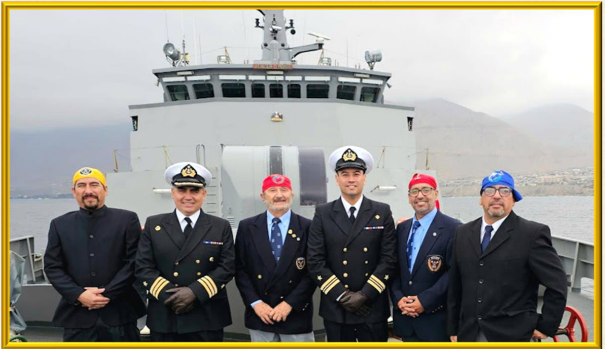
Partida de Abordaje de la Nao Tocopilla, presentando sus respetos al Comandante del Patrullero de Zona Marítima (OPV-82) "Comandante Toro", en visita de esta unidad Naval al puerto de Tocopilla, con motivo de las celebraciones de las Glorias Navales