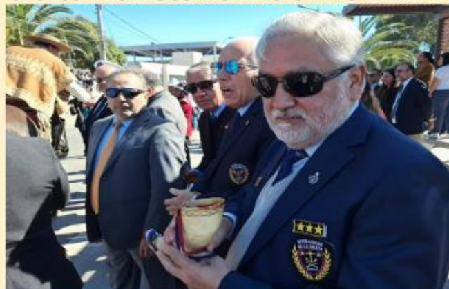
OOOOORZANDO CON PAJARETE POR LAS GLORIAS NAVALES.