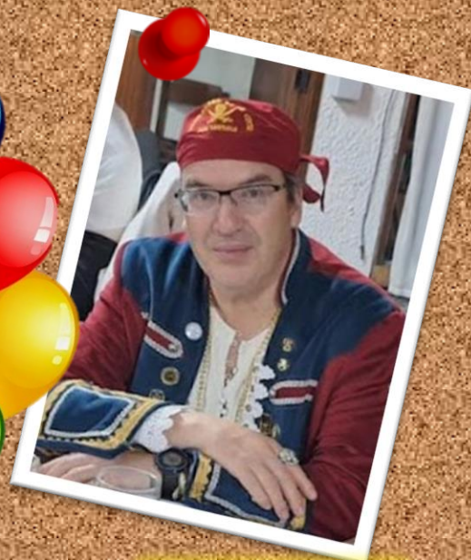
VITTO 11 de junio