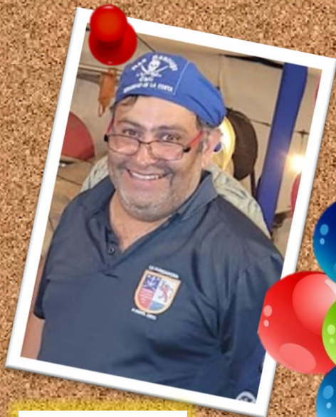
SPADA 2 de junio