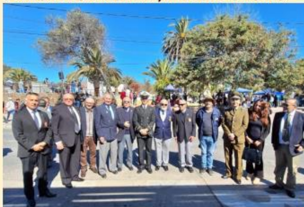
PIQUETE JUNTO AL CAPITÁN DE PUERTO Y AUTORIDADES PRESENTES.