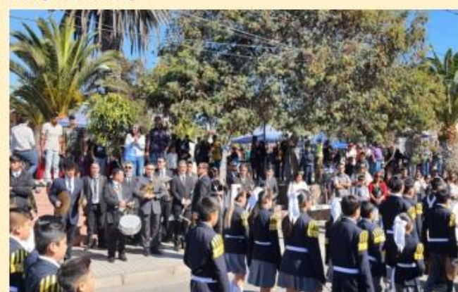
DESFILE CÍVICO DE LA COMUNIDAD ESTUDIANTIL.