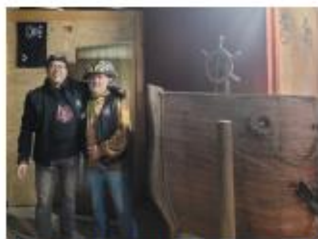
ZAFARRANCHO DE CAMBIO DE GUARDIA, SÁBADO 06 DE JULIO 13:30 HORAS EN LA CALETA DE HUASCO.