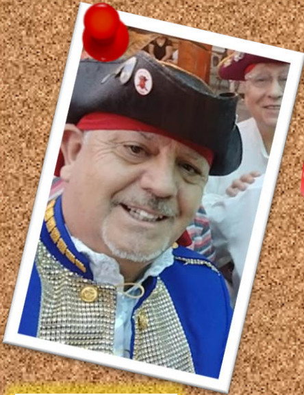
PSYCHO 3 de julio