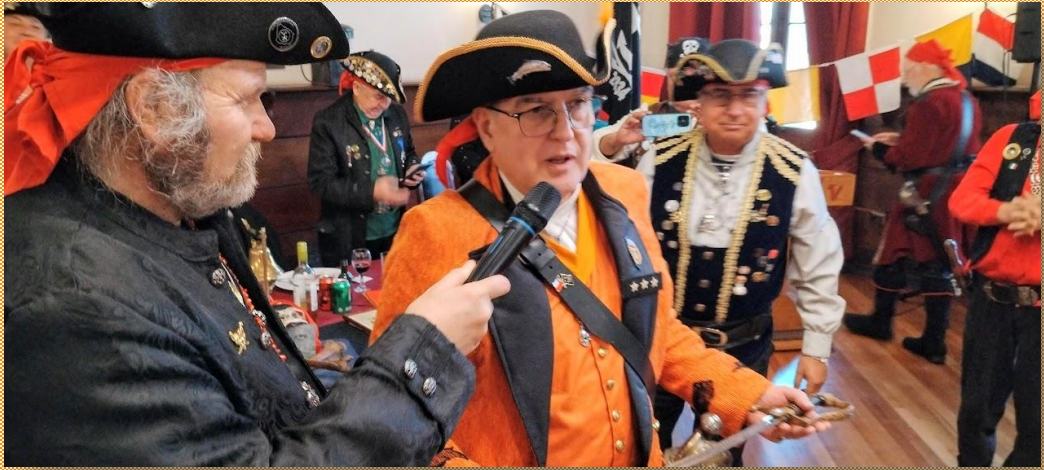
El Capitán SALMÓN recibe la espada de mando y toma el gobierno de la Nao Valparaíso.