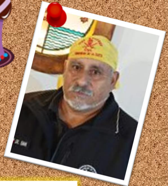
DR. SIMI 27 de julio