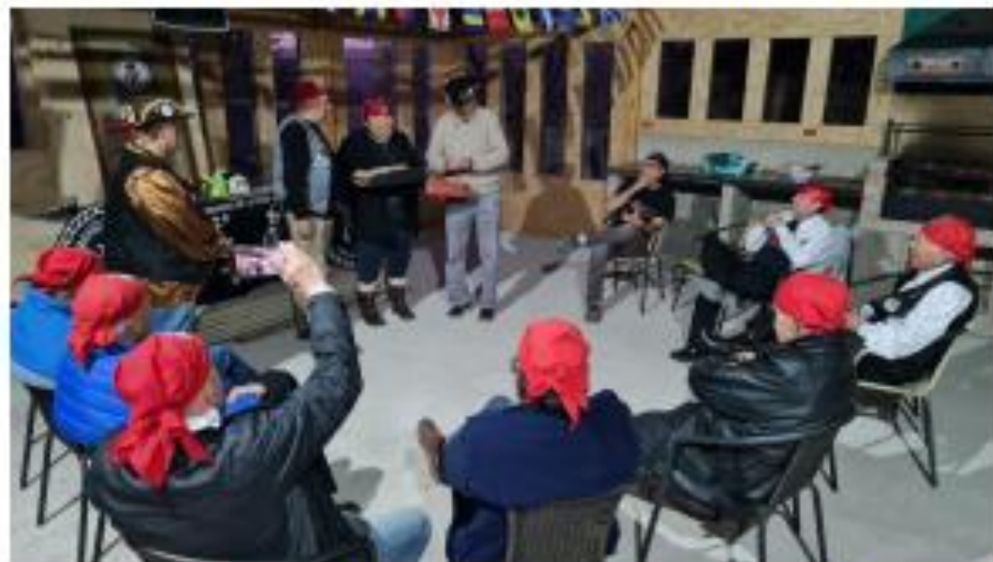
RESULTA ELECTO POR AMPLIA MAYORÍA, EL QUERIDO HERMANO ARIKI ARAGORN