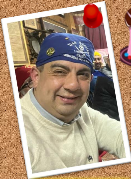
DRAKE 21 de julio