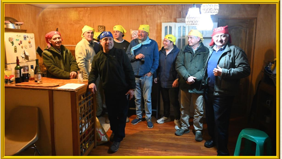
El Hermano FACINEROSO, Consejero de los XV y tripulante de la Nao Penco, visitó la Balsa Río Elqui y participó en una Cámara de Proa, ocasión en que se contrató un nuevo Bichicuma.