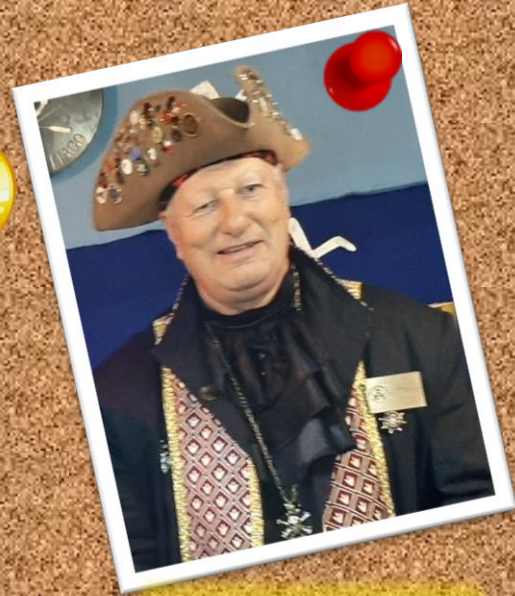
EUZKARO 8 de julio