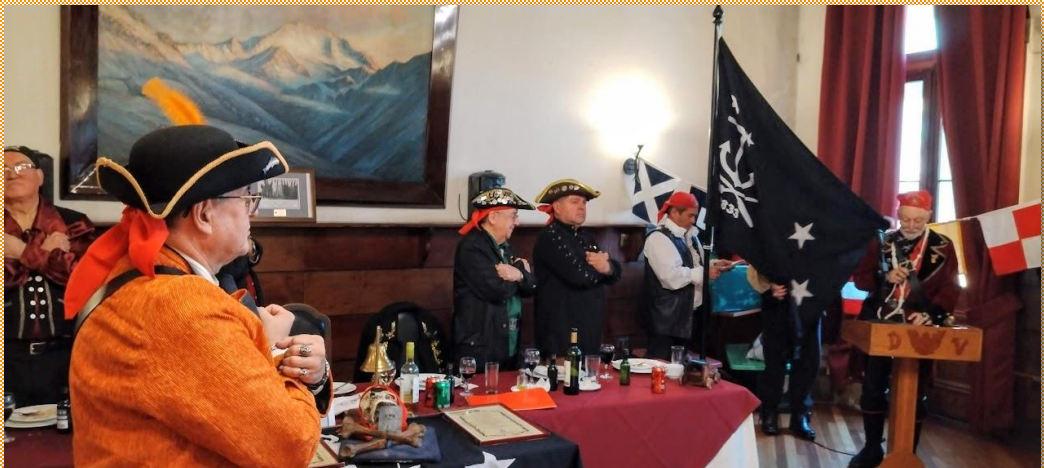
El Capitán SALMÓN observa la instalación de su bandera de combate, dando inicio a su singladura al mando de la gloriosa Nao Valparaíso.