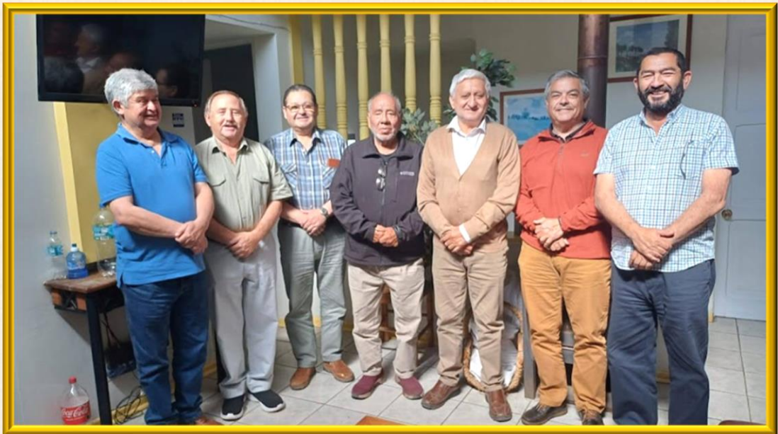
El Consejo de los XV sesionó con parte de sus Consejeros en la caleta de San Antonio. En la fotografía, durante un descanso de la jornada.