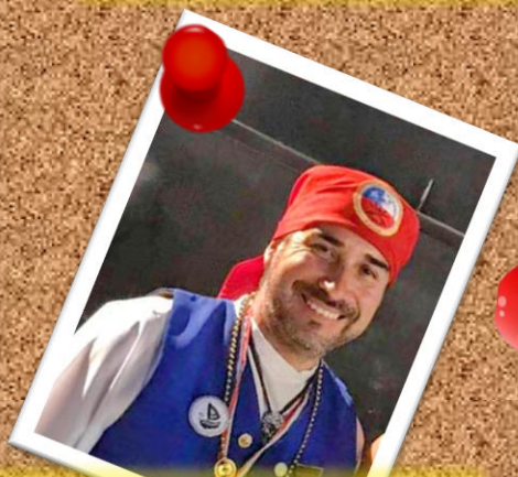
ENFACHADO 5 de noviembre