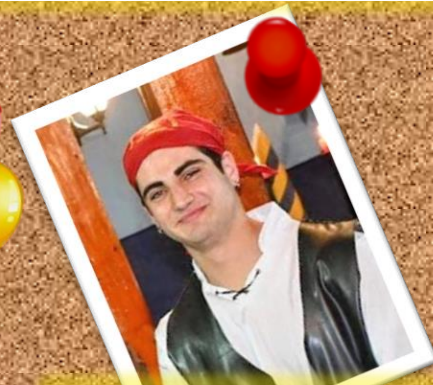
SALGARI 6 de noviembre