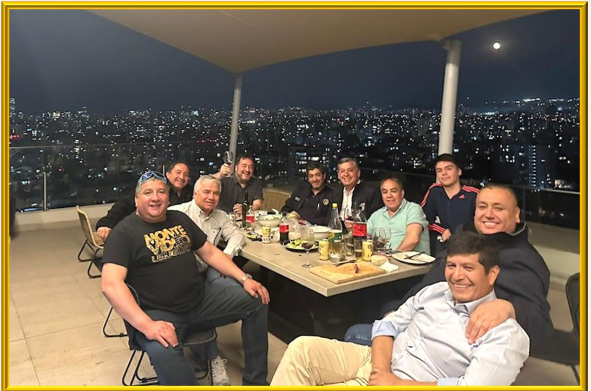
El Capitán Nacional SIMBAD compartiendo con sus Oficiales, previo a la jornada de trabajo programada para la Cámara de Oficiales Nacionales en la guarida de la Nao Santiago.