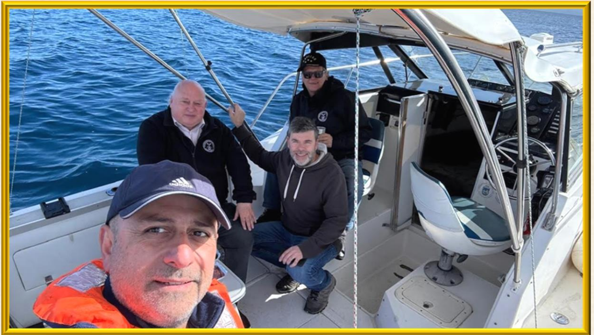
Navegación de la Nao Puerto Montt por las aguas del Lago Llanquihue, con bucán de recalada en una de sus riberas. OORZAAA!!!!