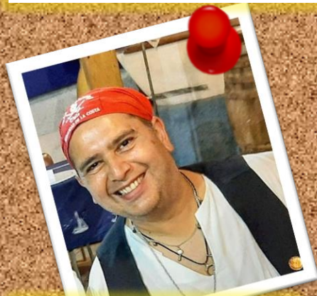
ESCORPIÓN 14 de noviembre