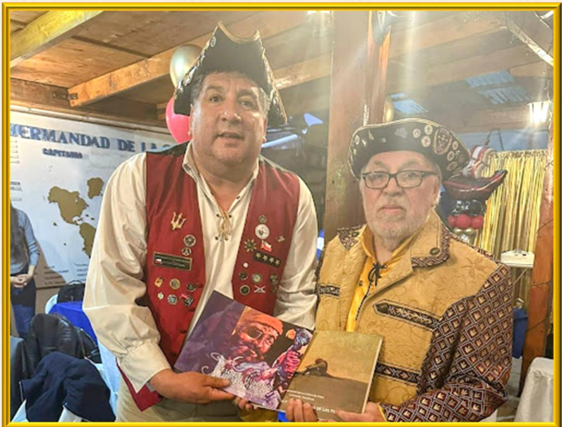
La celebración de la Boda Pirata de la Nao Santiago fue la oportunidad propicia para que el Capitán Nacional SIMBAD saludara y compartiera con el HHM N° 7 EL GERMANO, ocasión en que éste le hiciera entrega de algunos textos de su biblioteca, relativos a la Cofradía.