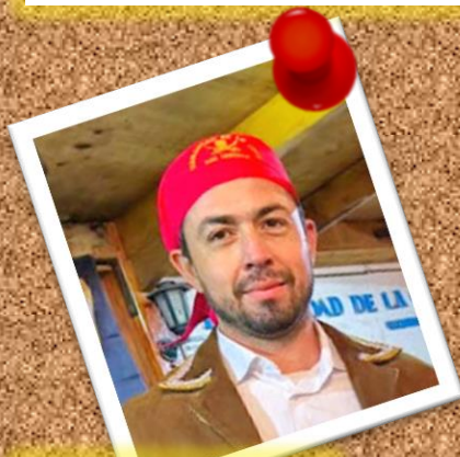
MOTA 22 de diciembre