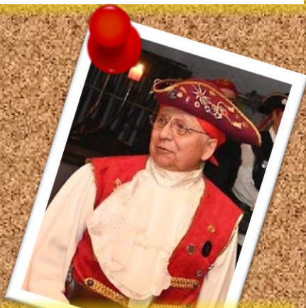
AVISPÓN VERDE 14 de diciembre