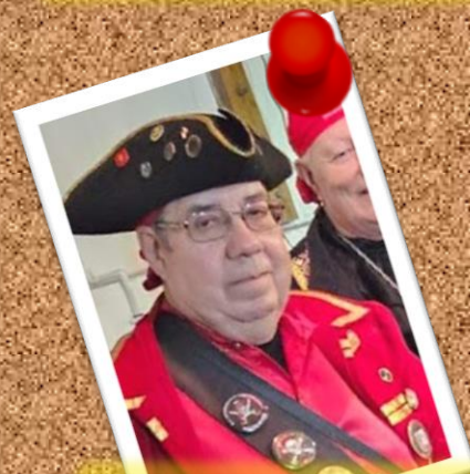
CORSARIO ESCARLATA 22 de diciembre