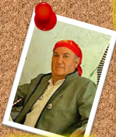
RAM 25 de diciembre