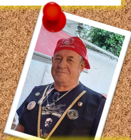
ARGOS 5 de diciembre