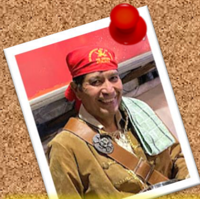
ATALAYA 1 de diciembre