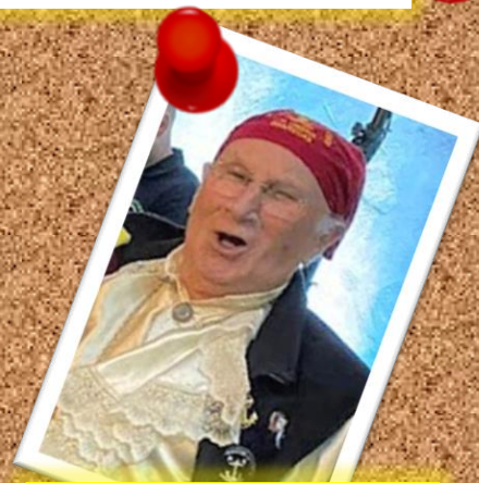
GUAITECAS 21 de enero