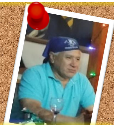
POCAS PATAS 21 de enero