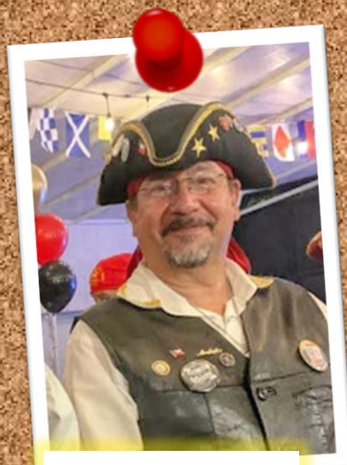
MERCATOR 27 de enero