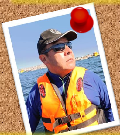
RACKHAM 16 de enero