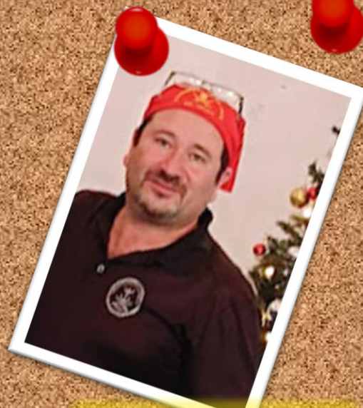
ALGARETE 5 de febrero