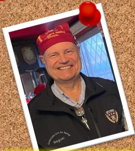
BAGUAL 3 de febrero